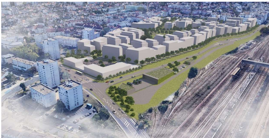
Photomontage du projet

Avril 2026 : Démarrage des travaux de requalification de l'avenue de Pontoise (RD30)