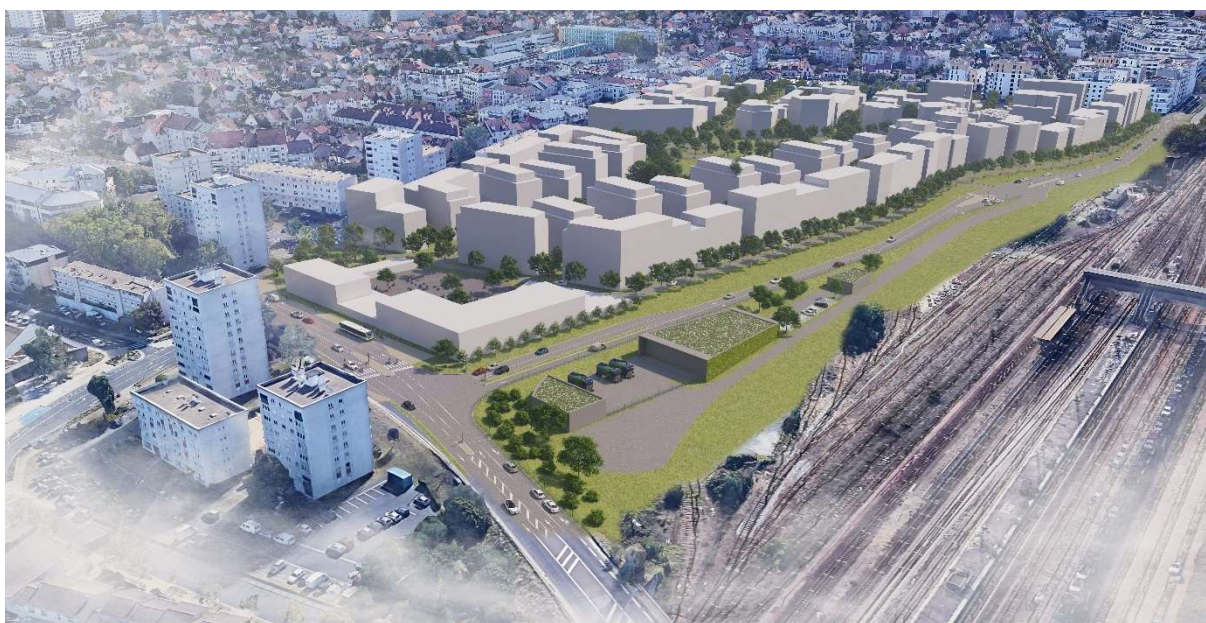
Photomontage du projet

Après une première phase de travaux qui a permis de mettre à niveau le terrain de la future voirie, l'aménagement du prolongement du boulevard de l'Europe à Poissy va démarrer.