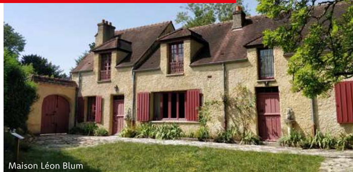
Maison Léon Blum