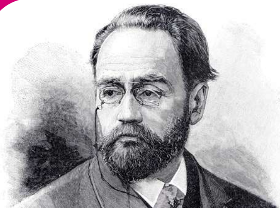
Portrait d'Émile Zola