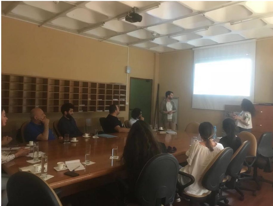
Présentation et correction de la note méthodologique des stagiaires à l'USEK

pomiculteurs et les usines de triages et les centres de conditionnement existants, ainsi que les voies d'amélioration de l'infrastructure de la filière de pomme.