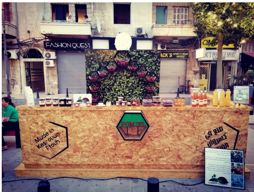
Stand "POMIEL" lors de la participation à l'évènement Estival de Jounieh – « BNOSS JOUNIEH »

Cette participation a ouvert une opportunité aux producteurs de promouvoir leurs produits à travers le stand POMIEL, et ont bénéficié d'un support technique de la graphiste de la Fédération pour créer une image de marque pour leur production. Il faut dire que quelques producteurs ont réussi à travers la participation au stand, de trouver des marchés pour leur production à l'extérieur, surtout pour le cidre et le miel de forêts, ainsi que de nombreux échanges entre les producteurs et les consommateurs sont établis.