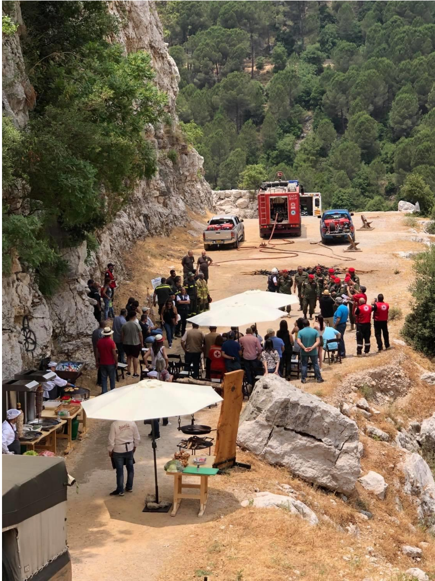
Manoeuvre effectuée par la Défense Civile et la Police de la Fédération l'équipe avec de PSF

De même, la Croix-Rouge Libanaise, suite à la demande de la Fédération, a fourni une formation de cinq jours consécutifs de premier secours pour une centaine de personnes des municipalités concernées, qui constituent l'ensemble des premiers intervenants de la zone pilote.