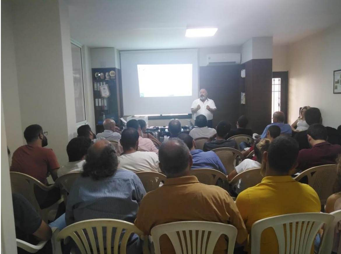
Une des sessions de formation sur les meilleurs pratiques de l'apiculture

L'objectif est de former 120 jeunes qui veulent débiter une activité apicole, et de les inciter à monter une association d'apiculteurs. Cela prouvera la motivation de ces jeunes et permettra à la Fédération d'avoir des interlocuteurs réceptifs à l'idée de travailler ensemble, puis sur le long terme, créer une coopérative.