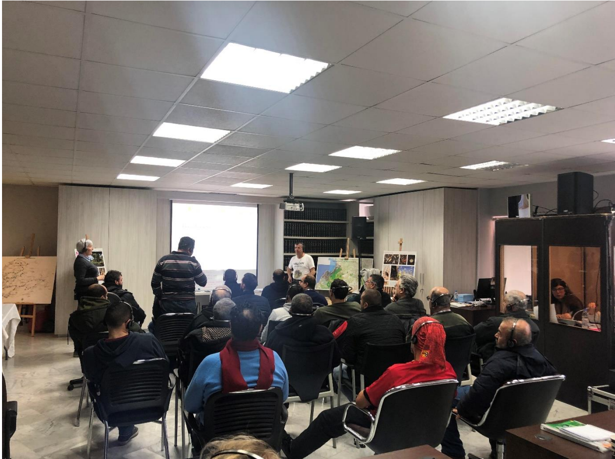
Ateliers d'échange sur l'apiculture au siège de la Fédération avec les apiculteurs du kesrouan-Ftouh

En 2019, trois autres études stratégiques ont été développées à travers le programme de stage de trois binômes d'étudiants grâce aux réseautages des deux collectivités sur leurs territoires. Cette année l'Université de Saint-Esprit de Kaslik a été aussi engagée par l'appel au stage au sein de la Fédération avec deux stagiaires sollicités par le Département des Yvelines pour s'installer à Jounieh pour une période de six mois afin d'effectuer trois études avec leurs partenaires libanais.