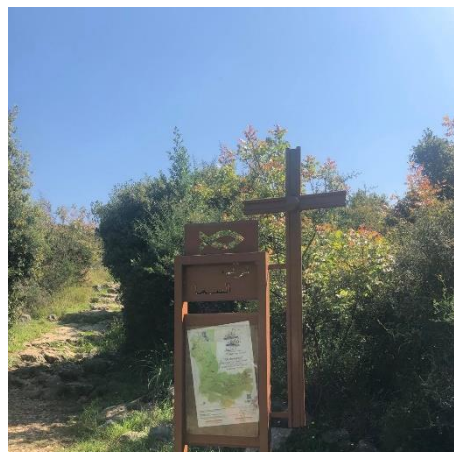
Panneau indicatif sur le sentier de "Darb el Sama"

Au cours de l'année, les deux sentiers existants (Darb el Sama et le Sentier de la Lune) qui s'élèvent en totalité de 16 km ont été entretenus et équipés de panneaux indicatifs et de signalisations après avoir rédigé un inventaire des besoins pour les maintenir. Les deux sentiers se situent à une proximité urbaine et se joignent à Notre Dame de Harissa, constituent un chemin de pèlerinage surtout durant le mois de Mai. Les dirigeants des sentiers affirment que les chemins sont devenus très fameux et attirent plus de 10,000 randonneurs par année. Ce qui nécessite des travaux continus pour les maintenir et pour les débroussailler régulièrement afin d'éviter tout risque d'incendie.