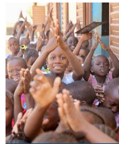
Pour l'émergence du Fouta

Les départements sénégalais disposent de responsabilités cruciales dans la planification du développement sur leur territoire. Les Yvelines sont partenaires de trois départements : Kanel, Matam et Podor, dont les plans de développement départementaux adoptés entre 2017 et 2018 ont bénéficié d'un cofinancement yvelinois. Pour promouvoir ces