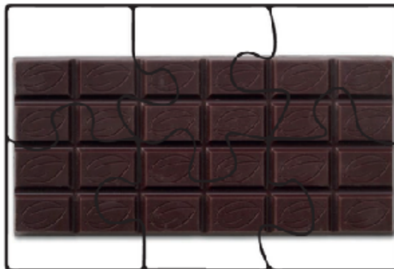
Exemples de puzzle