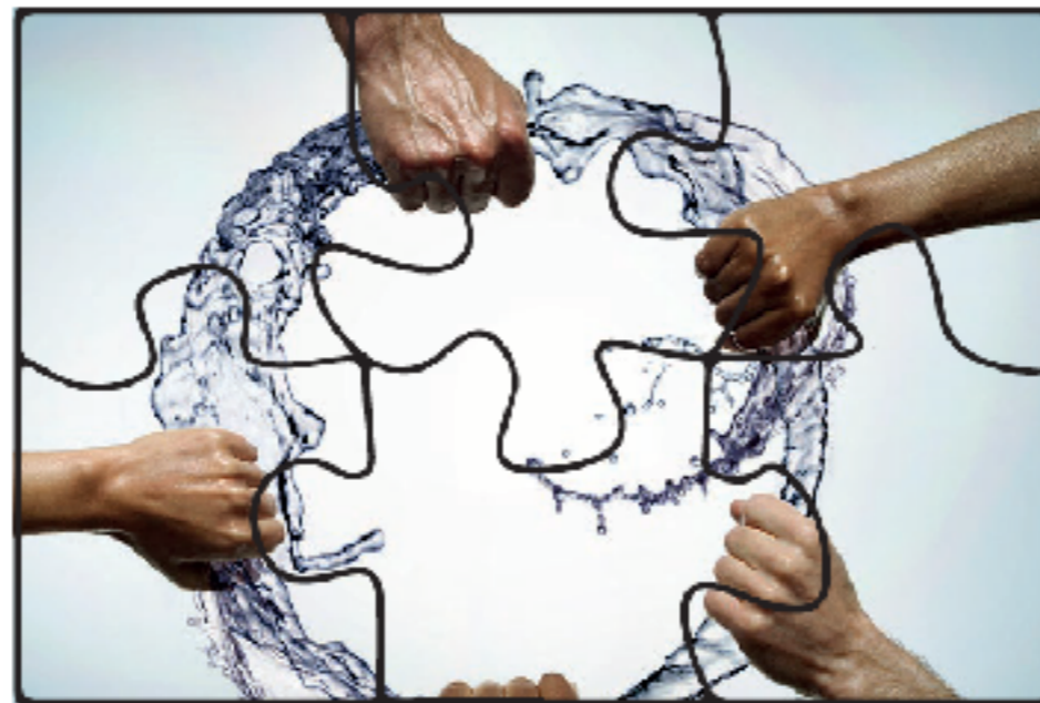
Exemple de puzzle