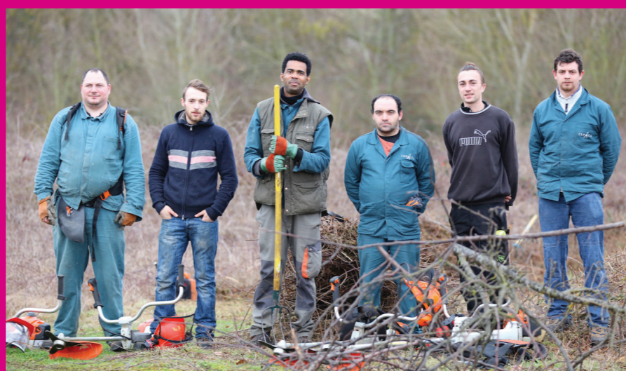
Insertion professionnelle : Restauration écologique d'un terrain à Montesson.