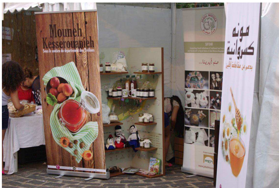
Le stand de la MRT lors des Soirées du vieux souk

Par ailleurs, à la demande du Président de la Fédération, la MRT a travaillé à la préparation d'un livre de promotion touristique du Kesrouan-Ftouh. Cette activité, initialement non prévue, doit remplacer l'édition de la brochure qui devait être spécifiquement éditée pour la promotion de la vallée Wadi-el-Salib.