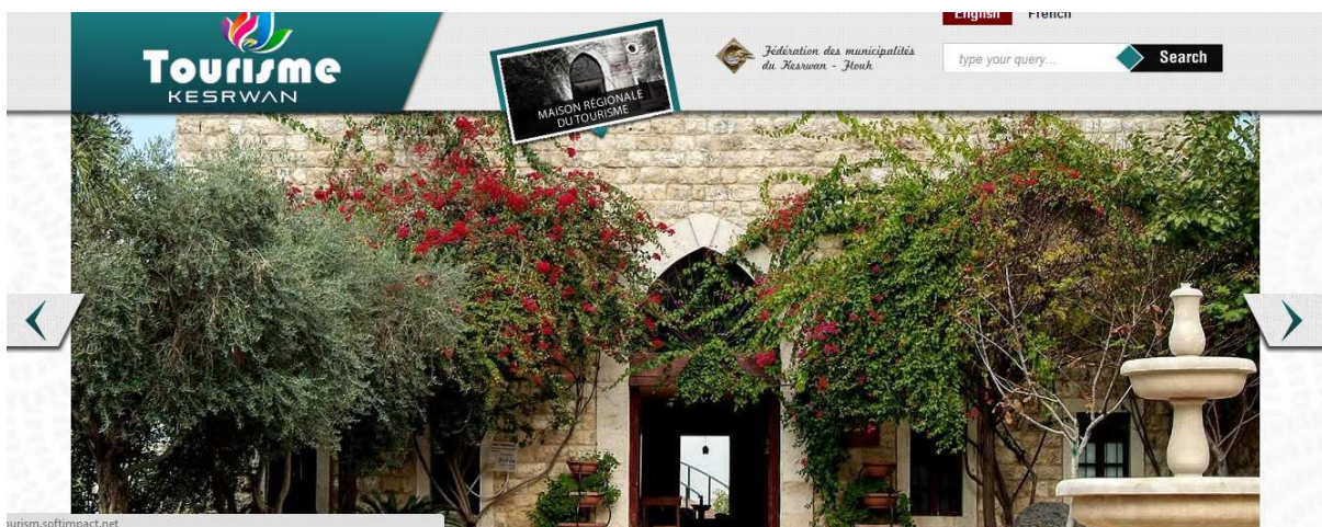
La page d'accueil du site « Tourism in Kesrouan »

Le site internet, comme exposé dans le rapport précédent, sera disponible en français et en anglais, et permettra aux visiteurs de consulter les actualités touristiques (activités, festivités, etc.) de la fédération. Il sera doté d'un moteur de recherche – outil nécessaire pour tout visiteur et touriste – en mesure de renseigner le visiteur à propos des hôtels, des compagnies de location de voitures, des services de restauration, etc.10