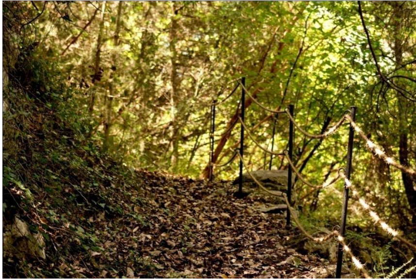
Une vue du Sentier des sources et des aménagements réalisés

Des travaux de terrassement, de nettoyage des cours d'eau, de retapage et de réhabilitation des 4 sources ont été effectués afin d'améliorer le débit.