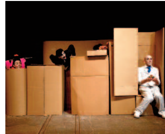
Compagnie le théâtre du Faune