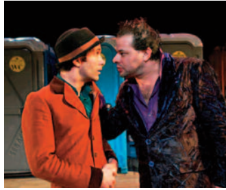
La Comédie des erreurs