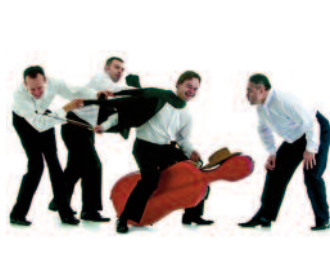
The MozART Group