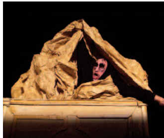
La Compagnie le Grand Manipule