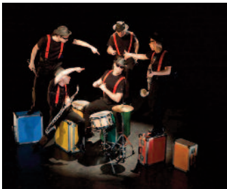
Les bons becs en voyage de notes