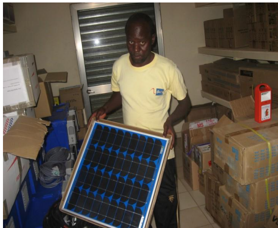
Panneau photovoltaïque Photalia pour les kits