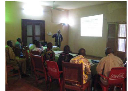
Le stage de formation à Bamako en novembre 2011