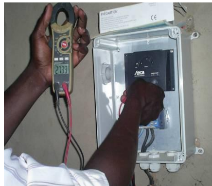
Installation d'un kit dans le village de Kotaga