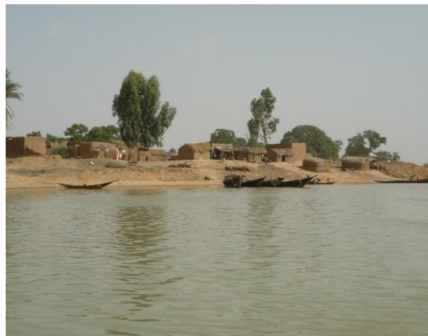
Le village de Daga Konna équipé en lampes rechargeables