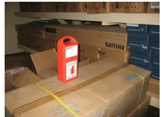
Lampe rechargeable ESF