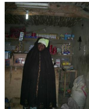
Un commerce équipé d'un kit dans le village de Kotaga