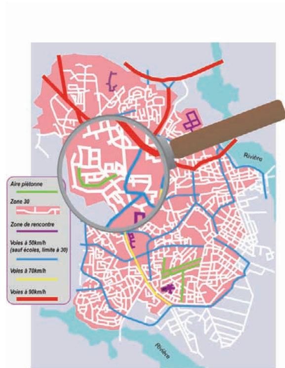
Plan théorique d'un réseau de voirie hiérarchisé

Elle est adaptée aux lieux qui présentent une forte densité de piétons (hyper-centre, lieux culturels, commerciaux, etc.), pour lesquels on souhaite créer un espace où l'on privilégiera l'absence de véhicules motorisés pour mener des activités qui cohabitent difficilement avec ceux-ci.