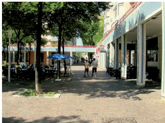
Organisation des occupations de l'espace public pour dégager un cheminement piéton

Par ailleurs, il peut être tentant de profiter de l'espace public dégagé de la circulation motorisée pour multiplier les autorisations d'occupation de cet espace notamment pour les commerces (terrasses de café, étalages, panneaux publicitaires, ...). Ces occupations font l'objet d'une autorisation auprès de l'autorité compétente et celle-ci devra veiller à délimiter clairement ce qui est compatible avec le cheminement libre de tout obstacle et s'assurer un contrôle régulier de l'occupation de l'espace public. En effet, dans tous les cas, on veillera à ne pas mettre d'obstacle au déplacement des piétons sur le cheminement privilégié (cf. personnes à mobilité réduite).