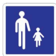
Panneau B54 Entrée d'une aire piétonne

Le choix d'un panneau montrant explicitement deux piétons, un adulte et une fillette, vise à exprimer la priorité du piéton et le fait que l'espace lui est réservé.