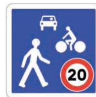
B52 Entrée d'une zone de rencontre