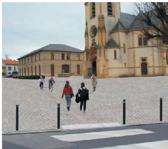
Grand parvis - photo CERTU/LREP