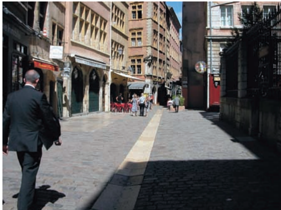
Rue piétonne quartier ancien