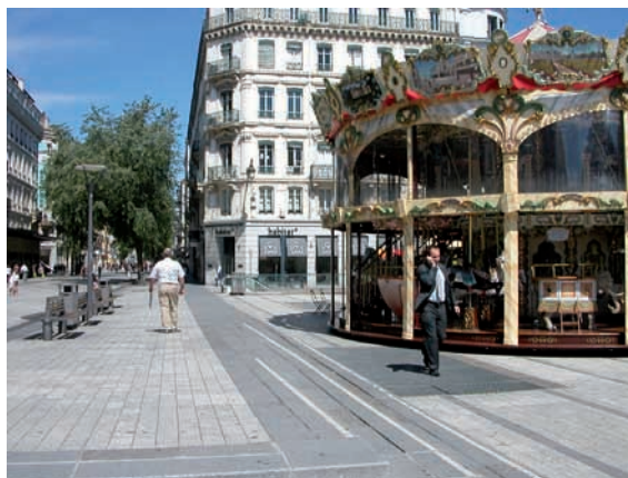
Organisation d'espaces dédiés au repos ou au jeu au sein d'une aire piétonne - photo LREP

Par ailleurs, il est possible de prévoir à l'intérieur des aires piétonnes des espaces dédiés à la pratique de certaines activités telles que des aires de jeu (que ce soit pour enfant ou pour adulte, par exemple des tables pour les jeux de société...). Il est conseillé d'aménager des espaces de repos pour tenir compte du vieillissement de la population et de la nécessité pour certains piétons de trouver des lieux où faire étape, même pour des déplacements de quelques centaines de mètres.