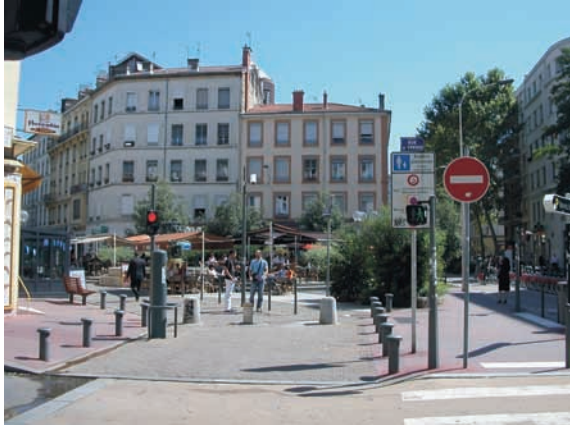
Régulation d'entrée d'aire piétonne

Pour la signalisation, comme il est de règle en milieu urbain, le recours au marquage au sol et à la signalisation de type routier est à éviter.