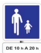
aire piétonne temporaire quotidienne