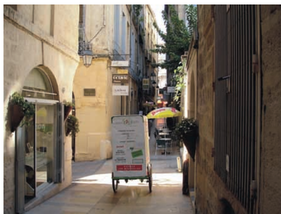
Livraison terminale en tricycle

Par ailleurs dans tous les cas, le passage de certains véhicules doit être maintenu ou une organisation adaptée doit être mise en place (notamment pour le ramassage des ordures ménagères