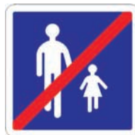
B55 Fin d'aire piétonne

La fin de l'aire piétonne peut être annoncée par un des panneaux suivants :