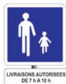
aire piétonne permanente avec règle d'accès