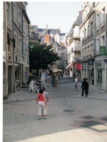
Rue commerçante