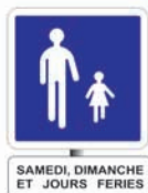
aire piétonne temporaire hebdomadaire (liée au loisir et au tourisme)

C'est un panneau zonal, c'est-à-dire que ses prescriptions s'appliquent à l'ensemble de la zone signalée (axe sur lequel il est implanté et ensemble des voies sécantes) jusqu'à ce que l'utilisateur franchisse un panneau modifiant cette prescription (B55, B52, B30, EB20), même si l'utilisateur change plusieurs fois de direction.