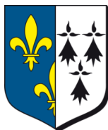
Ville de Houdan