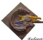
Federation des municipalites de Kgsrouan - Ftouh