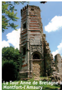
La Tour Anne de Bretagne à Montfort-l'Amaury

Destinée à alimenter les jeux d'eau du Château de Versailles, la chaîne des Etangs de Hollande, constituée d'un chapelet de 6 étangs sur 5 km, forme le plus bel ensemble en eau des Yvelines. Élément principal d'un réseau d'étangs et rigoles s'étirant jusqu'à Versailles, c'est aujourd'hui un espace naturel ouvert à tous, dans le respect des équilibres du territoire.