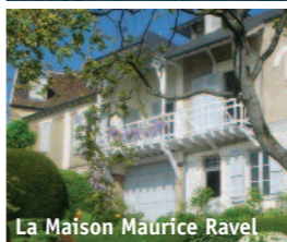
La Maison Maurice Ravel