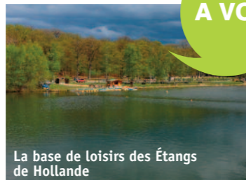
La base de loisirs des Étangs de Hollande