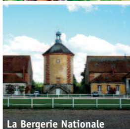
La Bergerie Nationale