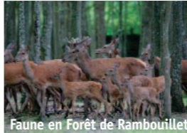
Faune en Forêt de Rambouillet