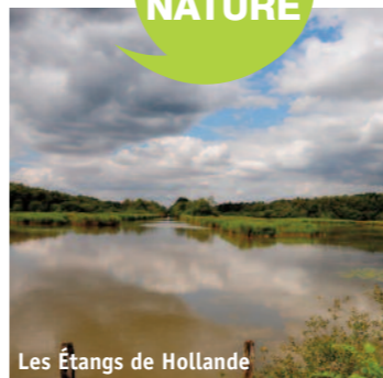
Les Étangs de Hollande