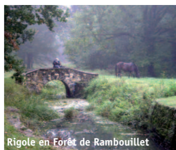
Rigole en Forêt de Rambouillet

Le dolmen néolithique dit Pierre-Ardroue ; une borne aux armes d'une famille (16 e s.),