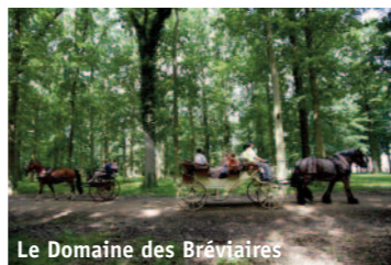
Le Domaine des Bréviaires

ancienne limite de terres seigneuriales ; la Croix Villepert (19 e s.), obélisque haute de 9 m vers où confluaient jadis 10 routes.