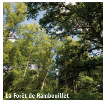
La Forêt de Rambouillet