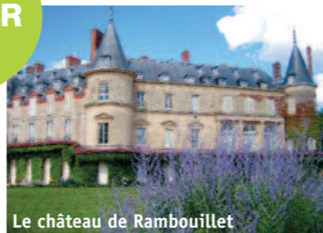
Le château de Rambouillet