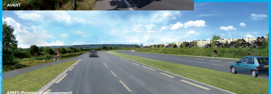
APRÈS (Principe d'aménagement)

Sur la section de la RD 30 requalifiée, les abords de la route seront engazonnés pour préserver les ouvertures visuelles vers les bords de Seine.