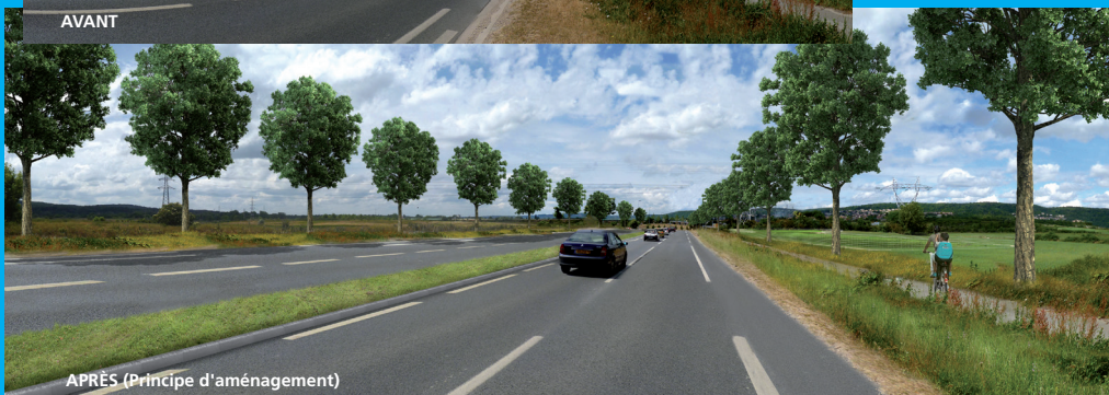
APRÈS (Principe d'aménagement)

Sur la section de la RD 190 requalifiée, il est prévu de planter des arbres de part et d'autre de la voie, dans la continuité des alignements existants qui caractérisent déjà cet itinéraire.