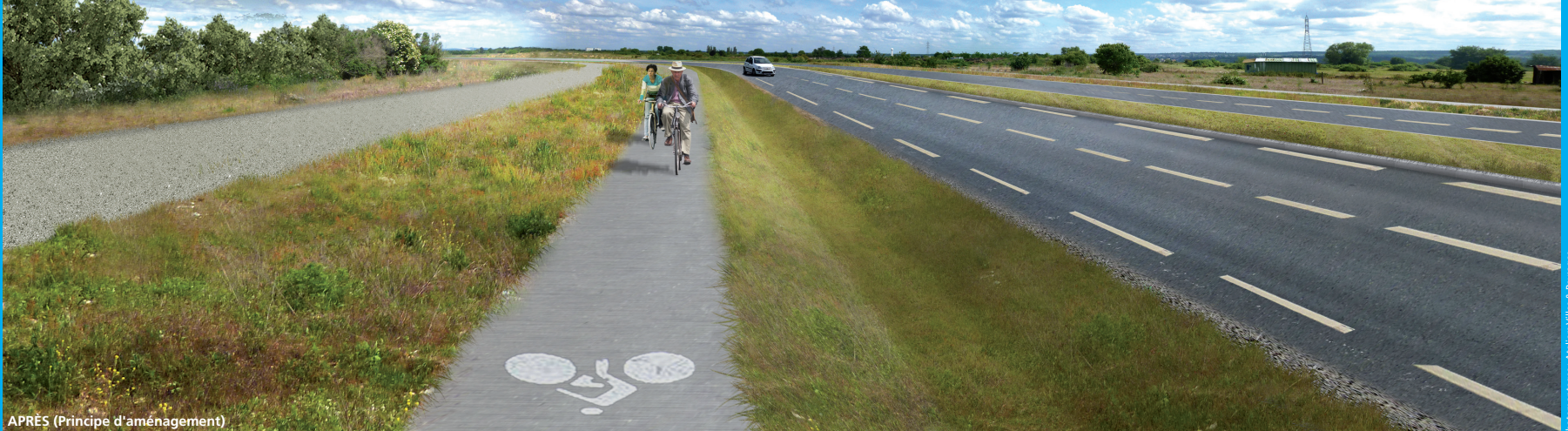
APRÈS (Principe d'aménagement)

Sur la section nouvelle entre la RD 190 et la RD 22, les abords de la voie seront engazonnés afin de ne pas souligner le projet et de conserver le paysage ouvert du Cœur de boucle. Seuls les bosquets traversés seront reconstitués.