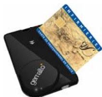
La pochette « intervenant »