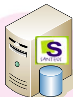
Un serveur central