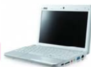
Un terminal de consultation

JOURNÉE D'ACCUEIL DES NOUVEAUX COLLABORATEURS